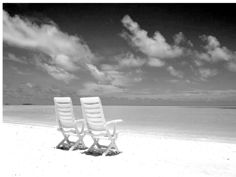
As férias de 30 dias são o merecido descanso após um longo ano de trabalho, somente podendo este período ser reduzido caso o bancário assim o queira, não o banco

Recentemente, o Tribunal Superior do Trabalho, mais alta corte trabalhista, analisou o caso de bancária admitida em janeiro de 1991 pelo HSBC Bank Brasil S/A - Banco Múltiplo, a qual comprovou que, desde