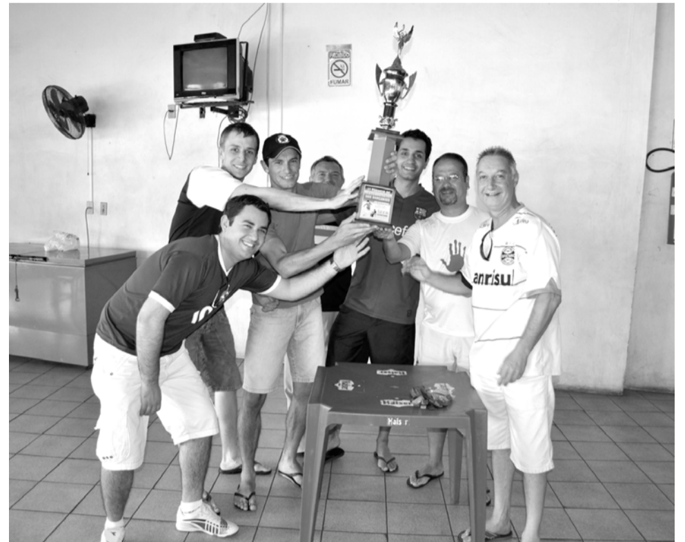
Após a conquista do título, foi realizado um churrasco entre os bancários

Veja no Facebook do Sindicato todas as fotos do torneio: www.facebook.com/bancariosm .