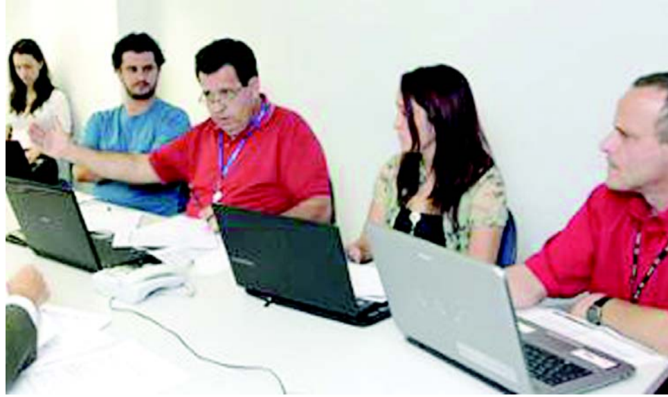
Em fevereiro, Comissão Paritária do PCS volta a se reunir com o objetivo de definir regras de avaliação por mérito do ano-base 2012

A avaliação seguirá critérios objetivos e subjetivos, correspondendo, respectivamente, 60% e 40% da pontua-