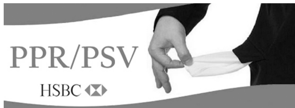
Proximidade da divulgação do balanço de 2011 aumenta expectativa dos funcionários

Nos últimos anos ocorreram não pagamentos, ora para o pessoal do back office,